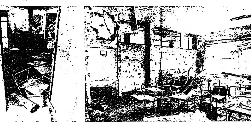
الدمار في المعهد الآسوتي - بعبد